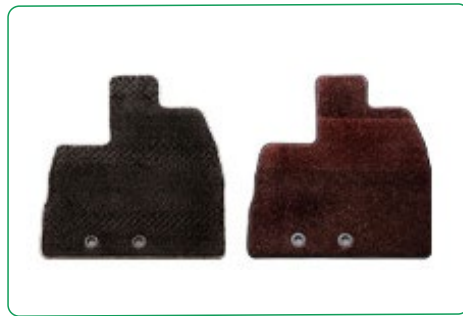
カラーバリエーション

オリジナルならではの!ラゲッジまでマットを設定。 車内全面をラグジュアリーな空間に。